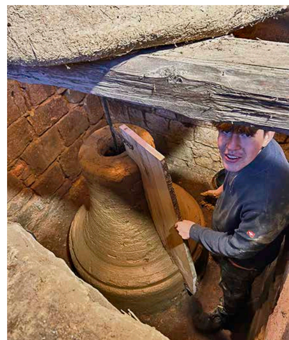
Witzleben Bauamt Verbgem