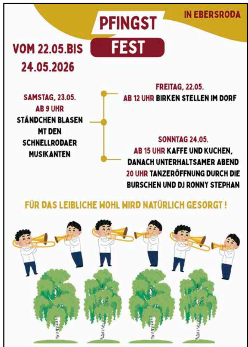
Plakat: Freizeit & Traditionsverein Ebersroda