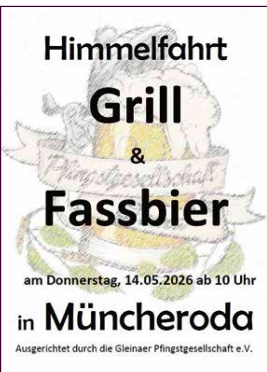
Plakat: Gleinaer Pfingstburschenverein e.V.