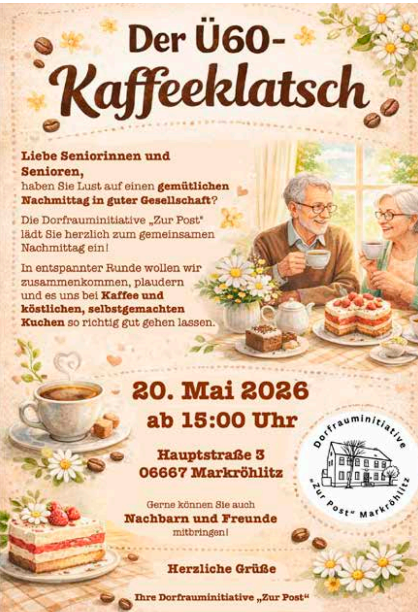
Plakat: Dorfrauminitiative „Zur Post“