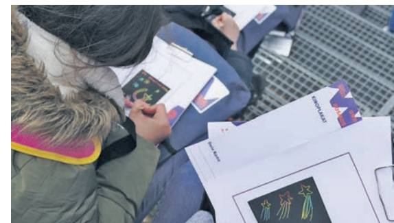
Entlang des Weges entstehen kleine Kunstwerke.